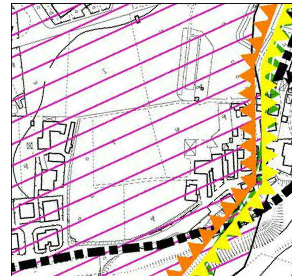
Estratto del PSC (Tavola 3C Gennaio 2016) - Scala 1:2000