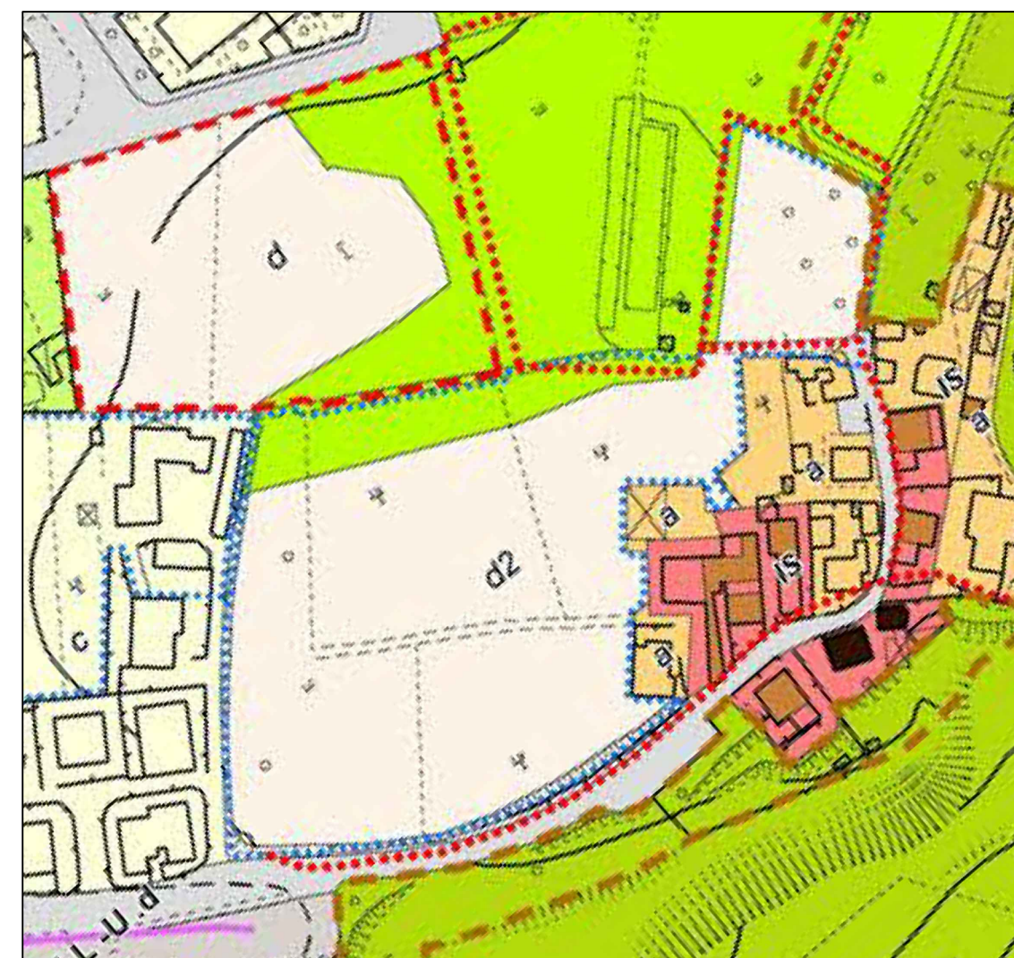
Estratto del PSC (Tavola 1C Novembre 2016) - Scala 1:2000